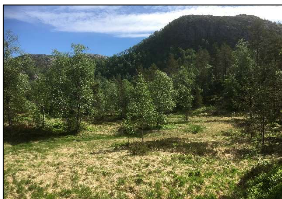
Figur 2. Foto viser myr hvor tomtene 4, 7 og 8 er plassert.

Feltsjiktet er ensformig med sterk dominans av blåbær og røsslyng.